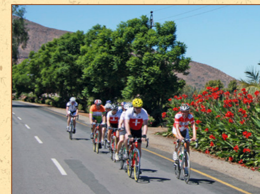
Das blumenprichtige Südafrika.

Besuchen Sie unsere Reiseberichte unter: www.gustizollinger.ch