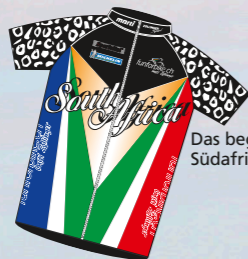
Das begehrte Südafrika-Trikot.