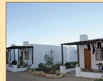
Wir logieren ausnahmslos in ausgezeichneten Hotels und Lodges. Bild: Game Lodge.

Nachtflug Zürich–Frankfurt–Kapstadt. Verpflegung an Bord. Flugdauer ca. 12 Std./1 Std. Zeitverschiebung.