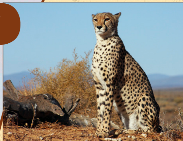
Dank der Unterstützung unserer Ranger werden wir viele Tiere sehen.