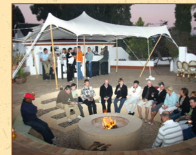
Fröhliche Stimmung bei Lagerfeuer-Romantik.

Besuchen Sie unsere Reiseberichte unter: www.gustizollinger.ch